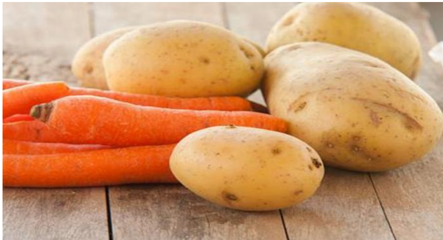
Gambar . 1 bahan