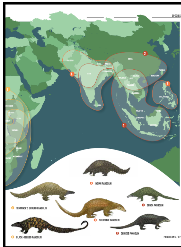
Gambar 3. Jaringan SD dan keterhubungan dengan E pemilik 250 kilo gram sisik trenggiling

dititipkan melalui truck atau travel transaksi tidak mengenal rekening bersama karena sudarko sendiri sudah cukup terpercaya dalam grup jual beli gaharu. Kebanyakan pembeli berbisnis yang sama dengan Sudarko yaitu jual beli kayu gaharu dan bagian satwa lainnya. Penyelundupan satwa liar lintas batas negara berpotensi untuk mengancam kelangsungan hidup spesies yang terancam punah, baik flora maupun fauna, pengalaman dimana perdagangan yang dilegalkan diizinkan akan membuka peluang untuk pemalsuan izin dan dokumentasi lainnya seperti health certificate (Gao et al., 2008). Menurut Rob White Morton, (2018) dalam kajian kriminologi terdapat tiga orientasi berbeda dalam pembahasan wildlife berbeda yaitu situasional, kontekstual dan ekonomi politik. Dalam hal ini kejahatan dan bahaya yang dikaji mencakup berbagai kegiatan diantaranya pencemaran, deforestasi, penurunan spesies, dan penyalahgunaan hewan (Daan et al., 2016).