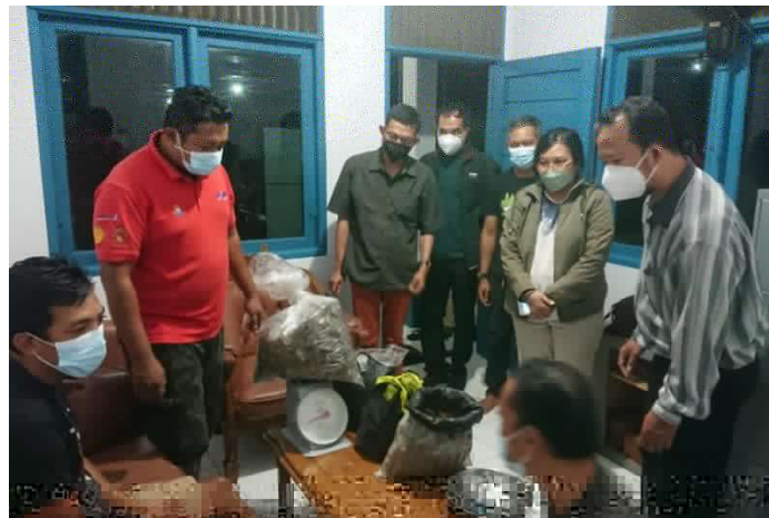
Gambar 3. Barang Bukti Sisik Trenggiling Hasil Pengembangan Penegak Hukum Sumber: Foto Ditjen Gakkum KLHK Wilayah Kalimantan Barat (Takandjandji & Sawitri, 2019.)

Tujuan hasil penindakan ini agar ditemukannya motif, modus, jaringan, komunikasi, dasar perilaku kejahatannya dan dilakukannya pemetaan kelompok transorganize crime / kejahatan terhadap satwa liar dilindungi. Kejahatan terorganisir dilakukan oleh kelompok terstruktur tiga orang atau lebih dalam periode waktu penuh dengan tipe kejahatan yang sangat serius.