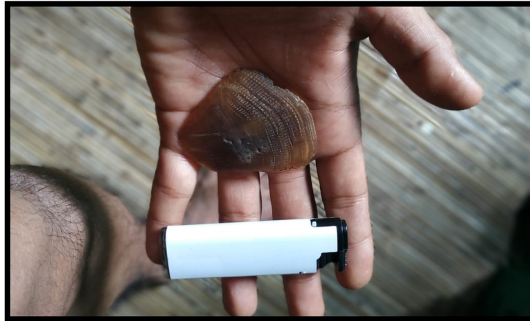
Gambar 1. Ukuran 1 sisik trenggiling