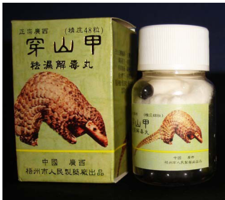
Gambar 4. Trenggiling menjadi bahan utama dalam traditional china medicine (TCM)