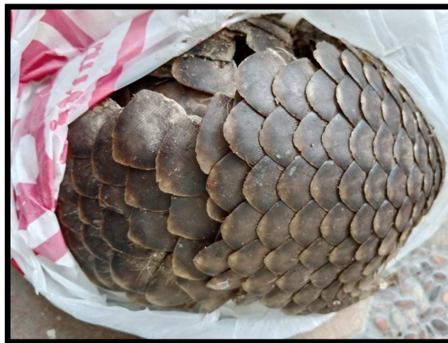
Gambar 2. Barang bukti SD dan BG berupa sisik trenggiling

Dari komunikasi Sudarko dengan beberapa rekannya juga ditinjau dari media sosial facebook dia cukup aktif memiliki banyak relasi dan faktor utama dia mengedarkan sisik trenggiling yaitu bermotif ekonomi atau keinginan uang secara cepat, selain sisik trenggiling dia berbisnis kayu gaharu yang memang termasuk jenis kayu yang dilindungi. Informasi tersebut didapat dari aparat penegak hukum yang menangani kasus tersebut.