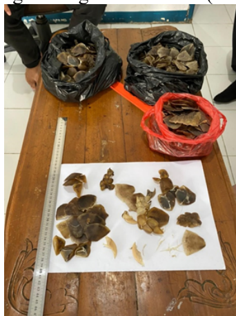
Gambar 4. Barang Bukti Sisik Trenggiling