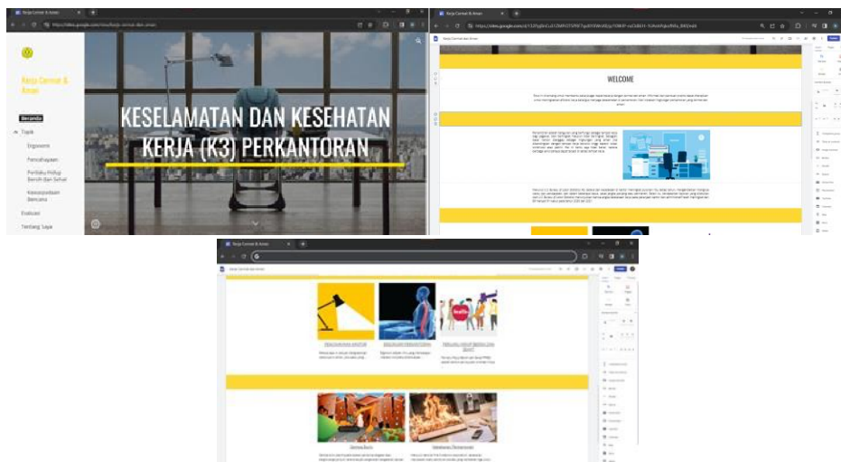
Gambar 1: Tampilan Website

Pada tahap produksi website, fokus utama adalah mengubah konsep dan desain menjadi produk nyata (Torgerson, 2016). Langkah ini melibatkan pembuatan konten materi pembelajaran yang relevan dengan Keselamatan dan Kesehatan Kerja (K3) untuk Perkantoran, serta pengembangan elemen interaktif seperti tombol navigasi.