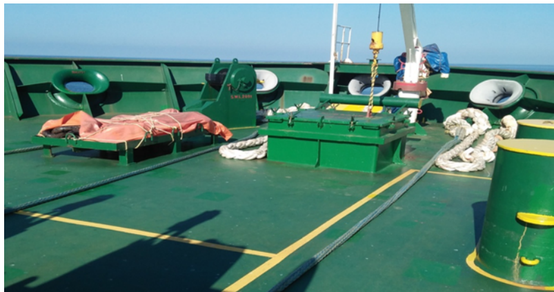
Gambar 5. Proses pelepasan tali dari drum mooring.

Cadet memposisikan tali secara terlentang agar tali lebih mudah digulung saat akan melakukan penggulungan kembali. Setelah itu, kadet bersama bosun melepas mata tali yang terikat di drum kemudian ikat mata tali yang lama pada tali, dan dipastikan ikatan tali secara kuat atau tidak kendur. Jika selesai melakukan perawatan maka gulung kembali tali pada drum dengan menggunakan mooring winch.