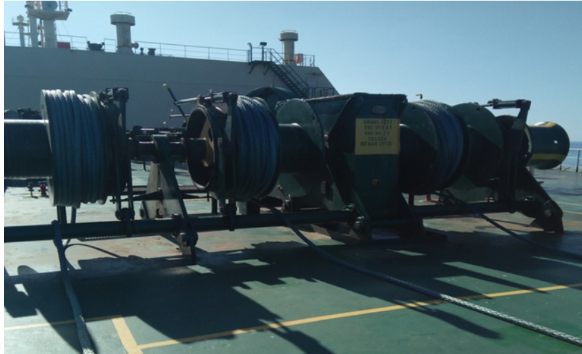
Gambar 6. Cadet Melentangkan Tali Tambat Di Bawah