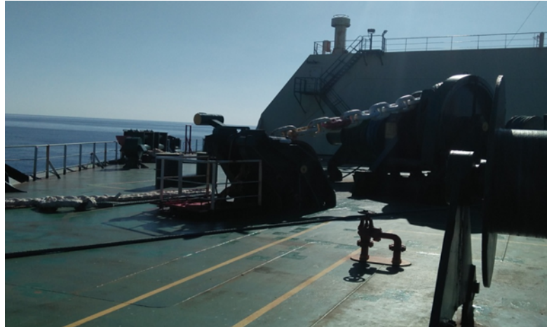
Gambar 3. Cadet dan crew melakukan Chipping

Selain itu, chief officer memberikan perintah kepada bosun untuk melakukan perawatan pada stopper anchor , lalu bosun memerintahkan cadet dengan AB(Able Seaman) untuk melakukan perawatan dengan merontokkan dan menghilangkan karat (chipping) bagian luar stopper anchor menggunakan hand chizzel lalu membersihkan karat dengan menggunakan grinder.