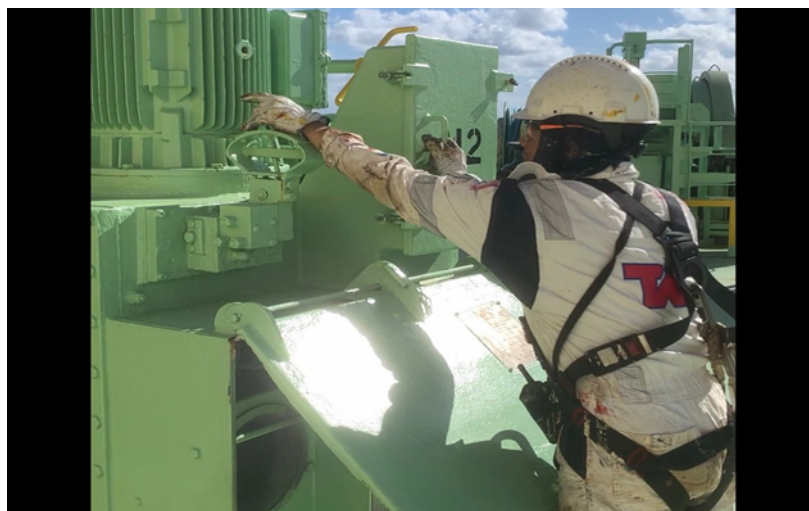
Gambar 4. Cadet dan crew OS (Ordinary Seaman) melaksanakan Chipping