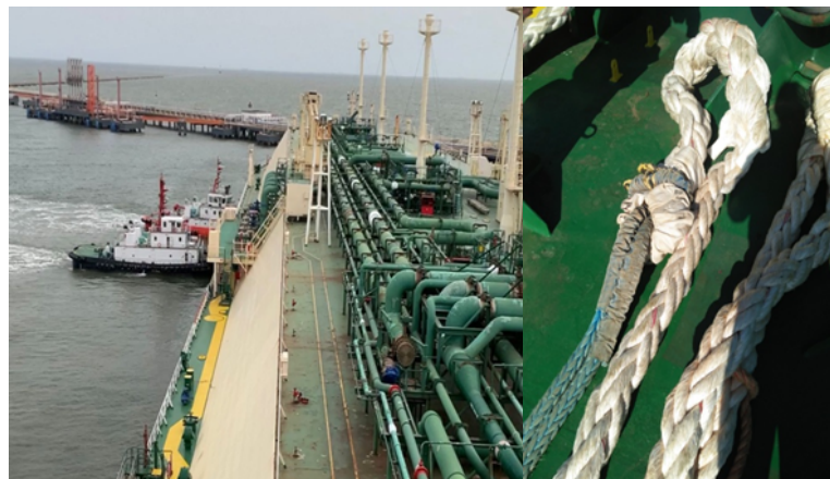
Gambar 7. Kondisi Tali Saat Kapal Saat Sandar Dan Persiapan