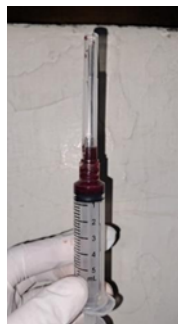
Gambar 2. Foto proof apex nasi. Didapatkan darah 1cc