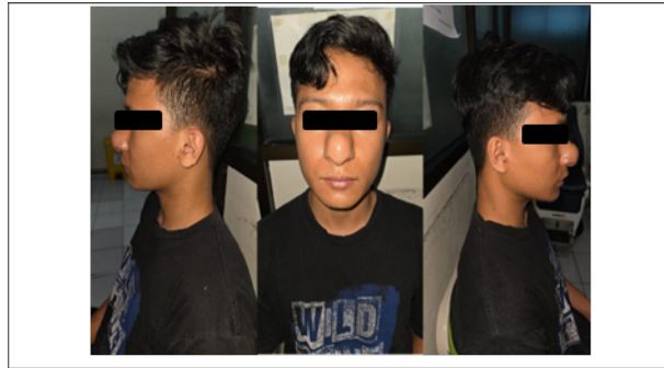
Gambar 9. Foto klinis setelah dilakukan embolisasi.