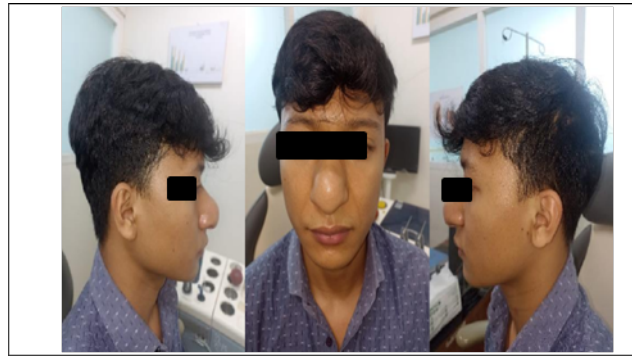
Gambar 7. Hari Ke-14 Pasca Insisi, Eksplorasi Dan Debridement Apeks Nasi. Masih Didapatkan Pulsasi Dibagian Apex Nasi

Dari hasil operasi didapatkan pulsasi dibagian apex nasi dan benjolan masih berukuran 3x2x1cm. Kemudian kami konsulkan ke Ts. Radiologi intervensi untuk tatalaksana embolisasi, sebelum melakukan tindakan embolisasi kita menjadwalkan untuk dilakukan CT angiografi, didapatkan hasil CT angiografi lesi heterodens pada soft tissue regio nasal yang pada post kontras tampak heterogenous contrast enhancement suspek massa, lesi bentuk serpiginous batas tegas tepi reguler yang menempati soft tissue regio nasal dan vestibulum nasal yang pada post kontras tampak strong contrast enhancement dengan feeding berasal dari cabang arteri fasialis bilateral dapat merupakan gambaran malformasi vaskular, dan sinusitis maksilaris kanan.