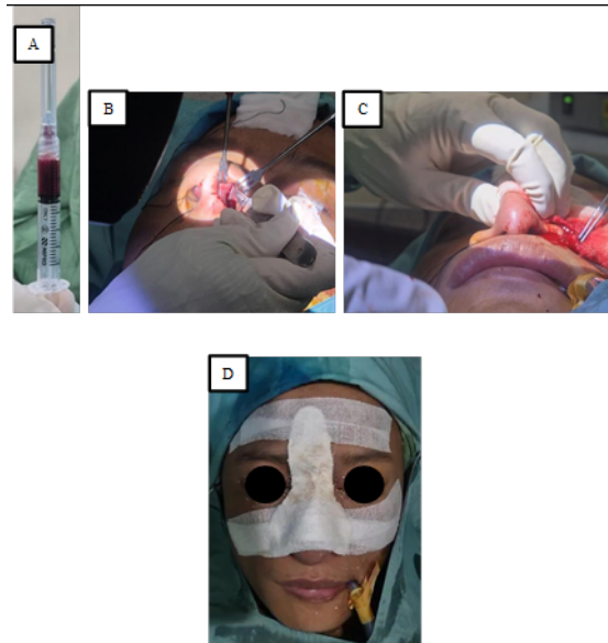
Gambar 5. Durante operasi. (A) Proof pungsi pada apex cavum nasi didapatkan 3cc darah (B) Dilakukan insisi pada dorsum nasi (C) Debridement pada luka insisi (D) Pemasangan split eksternal

Berkurang dan dievaluasi sumber perdarahan dengan couter dengan cara monopolar untuk menghentikan perdarahan. Setelah dilakukan operasi insisi, eksplorasi dan debridment, pasien diberikan terapi, IVFD Nacl 20tpm, Inj. Cefazoline 1gr/ 12 jam, Inj. As. Tranexamat 500mg/ 8 jam, Inj. Methylprednisolone 62,5mg/ 12 jam, Inj. Metamizole 1gr/ 8 jam. Dipertahankan split eksternal selama 2 minggu. Pasien dievaluasi pada hari pertama keluhan nyeri pada bagian hidung (+) minimal, perdarahan (-), pasien terpasang split eksternal (+). Pasien dipulangkan dan dikontrolkan 7 hari setelah operasi. Pada hari ke 14 tampak bengkak pada apex nassi (+), pulsasi (+). Pasien diprogramkan untuk CT-Angiografi dan penjadwalan untuk embolisasi oleh Ts. Radiologi intervensi.