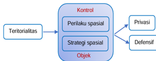
Gambar 7. Teritorialitas, Privasi dan Control

Privasi dapat dikelompokkan ke dalam dua kategori utama. Pertama, keinginan untuk menghindari gangguan fisik. Kedua, keinginan untuk mengatur dan mengendalikan perilaku pribadi (Firmansyah et al., 2022). Dinding, layar, batas simbolis, batas fisik, dan jarak merupakan mekanisme yang digunakan untuk menciptakan dan menjaga privasi (Zubaidi, 2019).