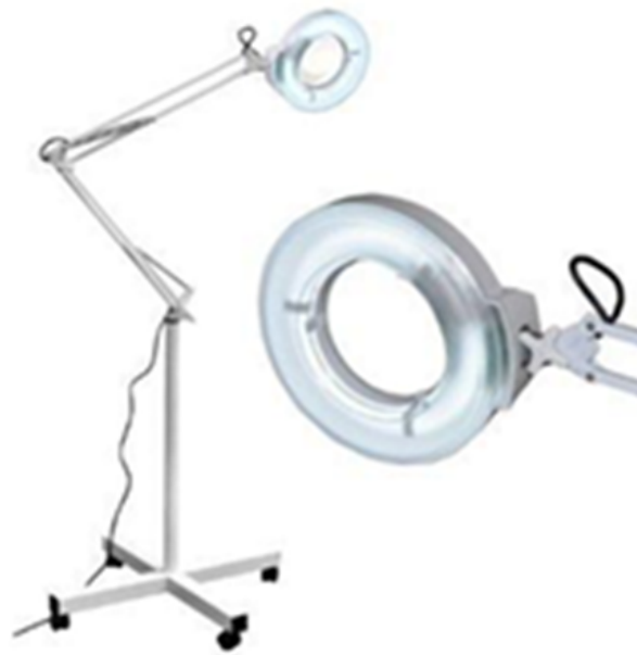
Gambar 4. LED Facial

Pencahayaan yang digunakan umumnya adalah LED facial.