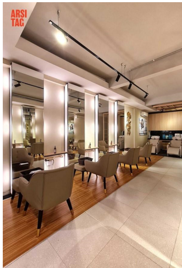
Gambar 6. Penggunaan cermin

Penting untuk menyediakan kaca besar agar pengunjung dapat melihat proses perawatan rambut yang sedang dilakukan. cermin besar memungkinkan pengunjung untuk memantau hasil perawatan dan memastikan bahwa teknik atau gaya rambut yang diinginkan sesuai dengan harapan mereka. Hal ini juga membantu meningkatkan kenyamanan dan kepuasan pengunjung selama prosedur perawatan rambut (Setiawan et al., 2016).