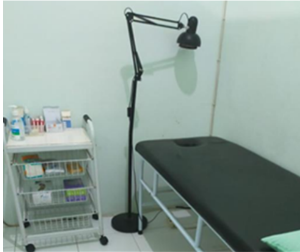
Gambar 2. Ruang tindakan wajah

kosmetik yang sesuai dengan jenis rambut, kondisi iklim, serta teknik-teknik perawatan yang digunakan (Huliatunisa et al., 2022).