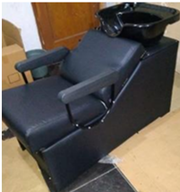
Gambar 1. Ruang Perawatan rambut

Data primer lainnya didapatkan melalui dokumentasi disajikan melalui gambar atau foto alat maupun ruangan, sebagai berikut.