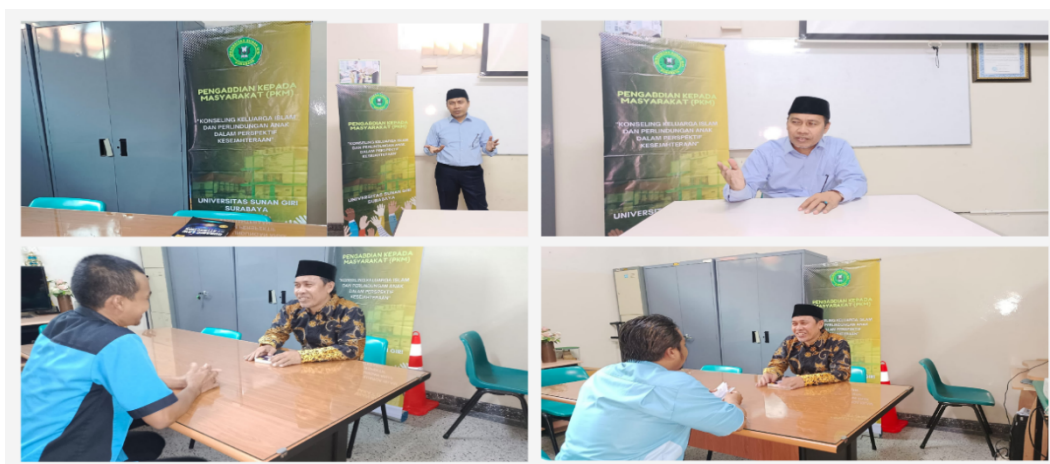
Gambar.2 . Penentuan ruang konseling dan pelaksanaan konseling

Pendampingan yang dilakukan dalam PKM adalah dengan menyiapkan layanan-layanan konseling keluarga secara terbuka kepada seluruh subyek PKM yang kiranya dapat memberikan panduan-panduan dalam menanggapi segala permasalahan dalam kehidupan keluarga dan anggota keluarga tetap menjaga secara konsisten privasi mereka masing-masing yang dapat dilakukan kapan saja baik melalui konsultasi secara tatap muka maupun konsultasi daring yang akan dilakukan oleh konselor-konselor sesuai bidangnya melalui kerjasama sama masing-masing koordinator bidang yang ada di institusi SMP Al Hikmah Surabaya. Seperti bidang pendidikan, agama, bimbingan konseling kesehatan mental, dan parenting yang akan bersinergi dalam memberikan bimbingan dan layanan kepada seluruh karyawan tehnik dilingkungan SMP Al Hikmah Surabaya. Tentunya program layanan ini tidak menjadi keharusan tetapi hanya sebagai sarana optional yang dibutuhkan oleh seluruh anggota karyawan tehnik di SMP Al Hikmah tersebut sesuai dengan tingkat dan kadar arah permasalahan yang mereka alami, agar semua problematika tersebut segera dapat terselesaikan secara efektif.