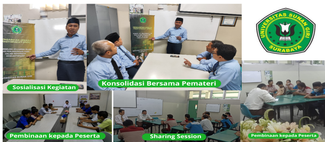
Gambar. 1. Dokumentasi Kegiatan PKM

Materi-materi tersebut disampaikan oleh para pemateri yang mereka adalah para pengajar di SMP Al Hikmah Surabaya yang telah disesuaikan disiplin ilmu yang diampu, sehingga kegiatan ini secara tidak langsung akan menjadi kegiatan dan program yang dapat diselenggarakan di setiap kegiatan sekolah yang dapat dilakukan secara terus menerus disetiap tahun dan dapat diprogramkan melalui program sekolah dalam memberikan bimbingan dan pembinaan kepada seluruh karyawan tehnis dan tenaga pendidik di lingkungan sekolah Al Hikmah Surabaya dalam upaya membangun harmoni antara ruang kerja dan ruang keluarga.